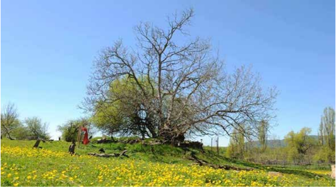
Fotoğraf-2: Türbe Üzerinde Bulunan Ceviz Ağacı