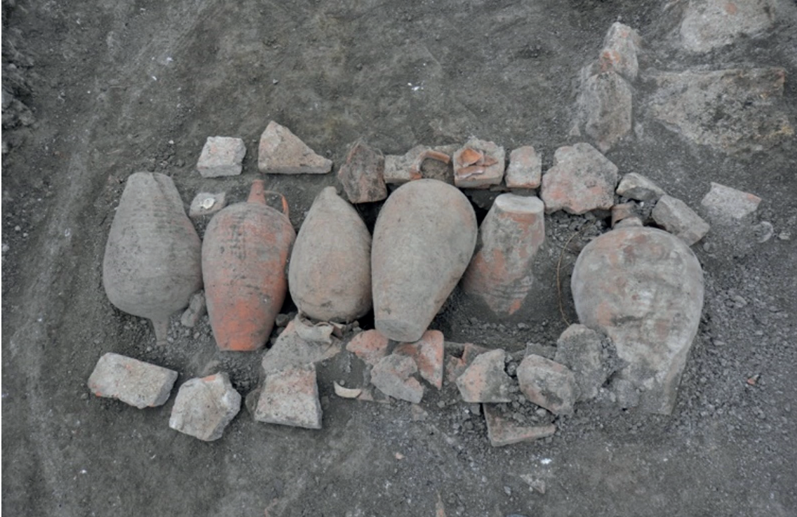
Fotoğraf-6: Şihmezit Kazılarında Bulunan Su Testileri

Bir gün dergaha bir sepet nar geldi. Hacı İzzeddin narları talebelere dağıttı. Bir tanesini de kendisi yedi. Nardan bir tanesi yere düştü. Hacı İzzeddin o taneyi alıp bir yere gömdü. Gömer gömmez ondan bir ağaç oluverdi. Sonra talebelerine 'buraya bir kabir kazınız' buyurdu. Talebeler onun yanına bir kabir kazdılar. O,