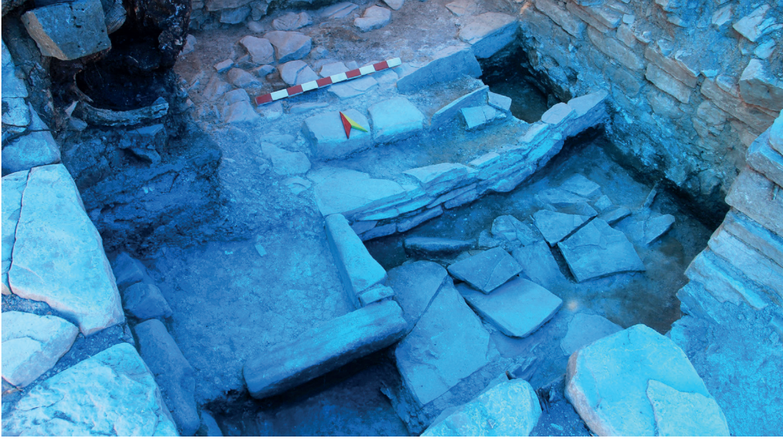
Fotoğraf-3: Pîr Ömer Halvetî'nin Mezar Odası

dır. (Fotoğraf-3) İkinci yardımcı oda ise çok sonraları XIX. yüzyılda Pîr Ömer'in halifesinin neslinden olan şeyh ve oğlunun gömüldüğü odadır. Kazıda önce yardımcı oda temizlendi ve iki mezar taşı bulundu. Birinci mezar taşı Pîr Ömer'in halifesi Sultan Bayezid'in (Bayezid Pirânî) evlatlarından Şeyh Celil'e, ikinci mezar taşı ise onun oğlu Allahvermiş'e aittir. Buradan anlaşılan Pîr Ömer'in halifesi Sultan Bayezid'in neslinin XIX. yüzyılda halen Avahıl Köyü'nde yaşadığı ve Pîr Ömer'in mezar odası karşısında, ayak ucunda medfun olduğudur. Bu durum, aynı zamanda, Pîr Ömer'in hatırasının uzun yıllar Azerbaycan'da canlı tutulduğunu göstermektedir. 7