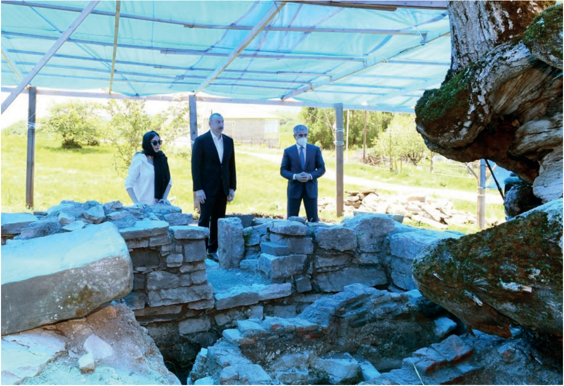
Fotoğraf-5: Azerbaycan Cumhurbaşkanı İlham Aliyev, Eşi Mihriban Aliyeva ve Cumhurbaşkanı Yardımcısı Anar Elekberov'un Kazı Esnasındaki Ziyaretlerinden Bir Görüntü