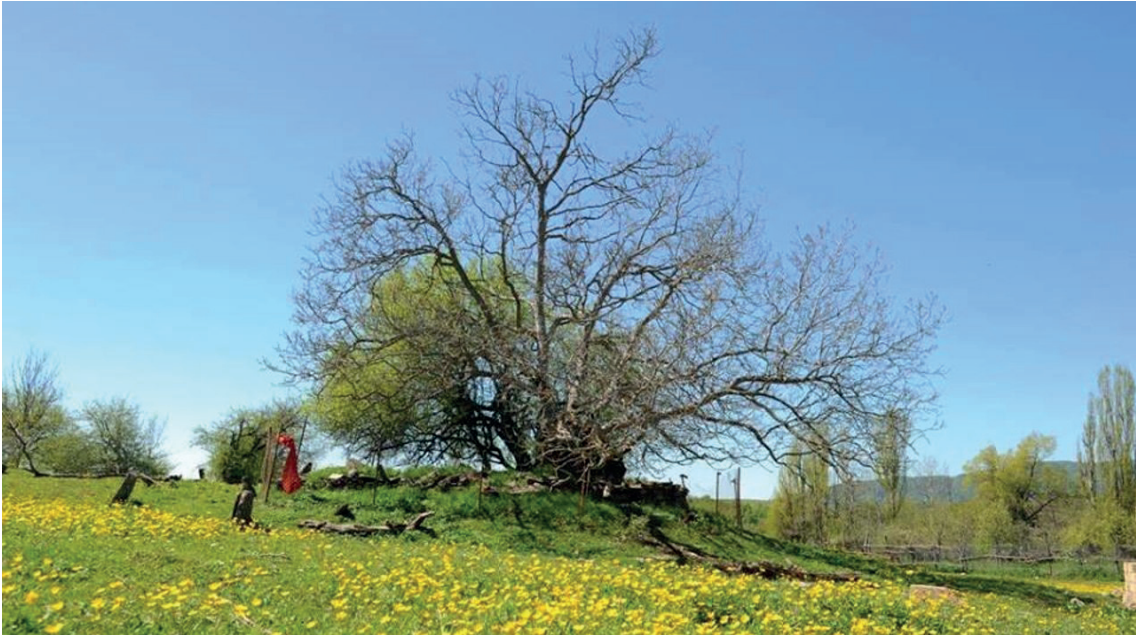
Fotoğraf-2: Türbe Üzerinde Bulunan Ceviz Ağacı