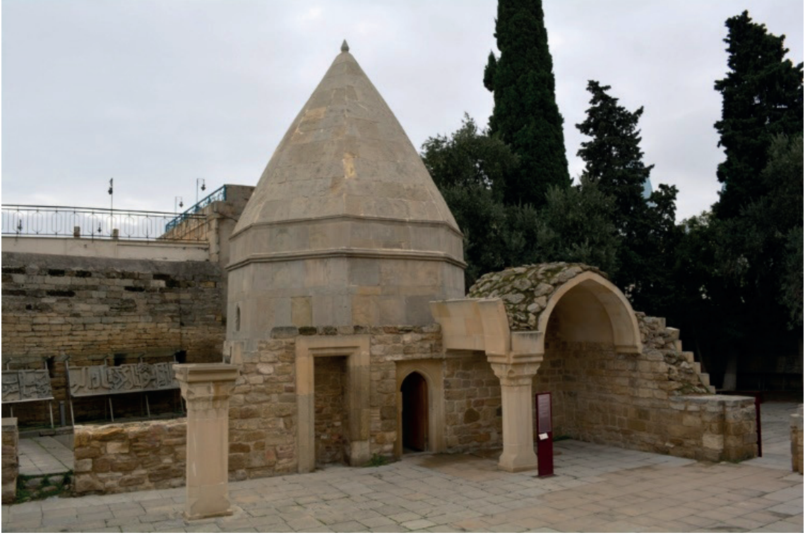
Fotoğraf-7: Seyyid Yahya Şirvânî Hangâhı

oradadır. 14 Tüm kaynaklarda yazıldığı gibi Seyyid'in Anadolu'dan gelen müridleri ona Bakü'de ulaşmışlardır.