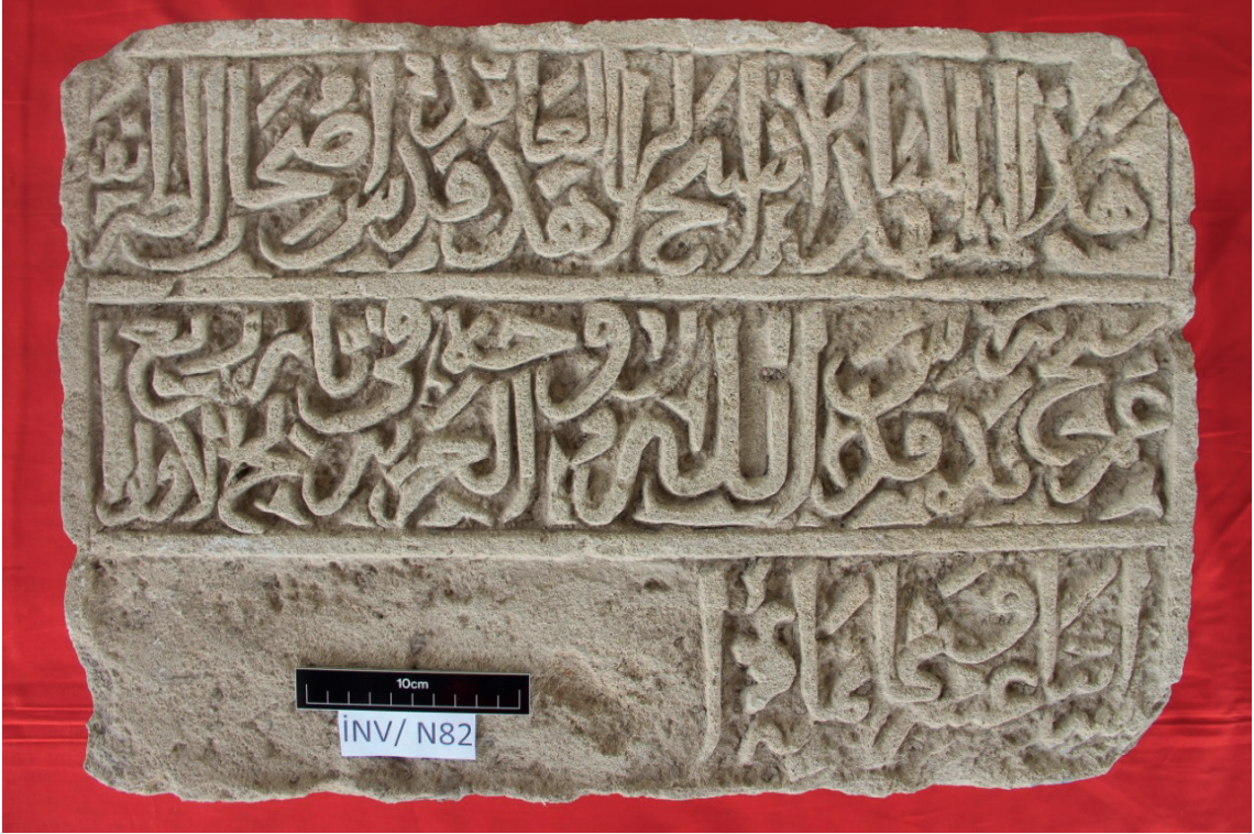
Fotoğraf-4: Pîr Ömer Halvetî'nin Türbe Kitâbesi